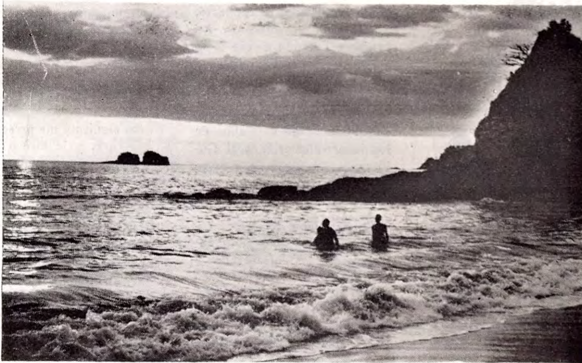
Bellísima fotografía de los pintorescos peñascales tendidos sobre el lecho de las aguas en las tranquilas playas de "Manuel Antonio" en Quepos, que son como una defensa natural que permiten al turista gozar de los baños de mar sin el peligro de las grandes oleadas.