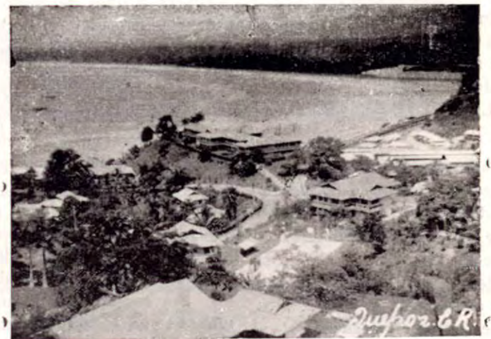
Vista parcial de la Ciudad de Quepos.

Ya no necesita hacer sus pedidos de repuestos a San José.